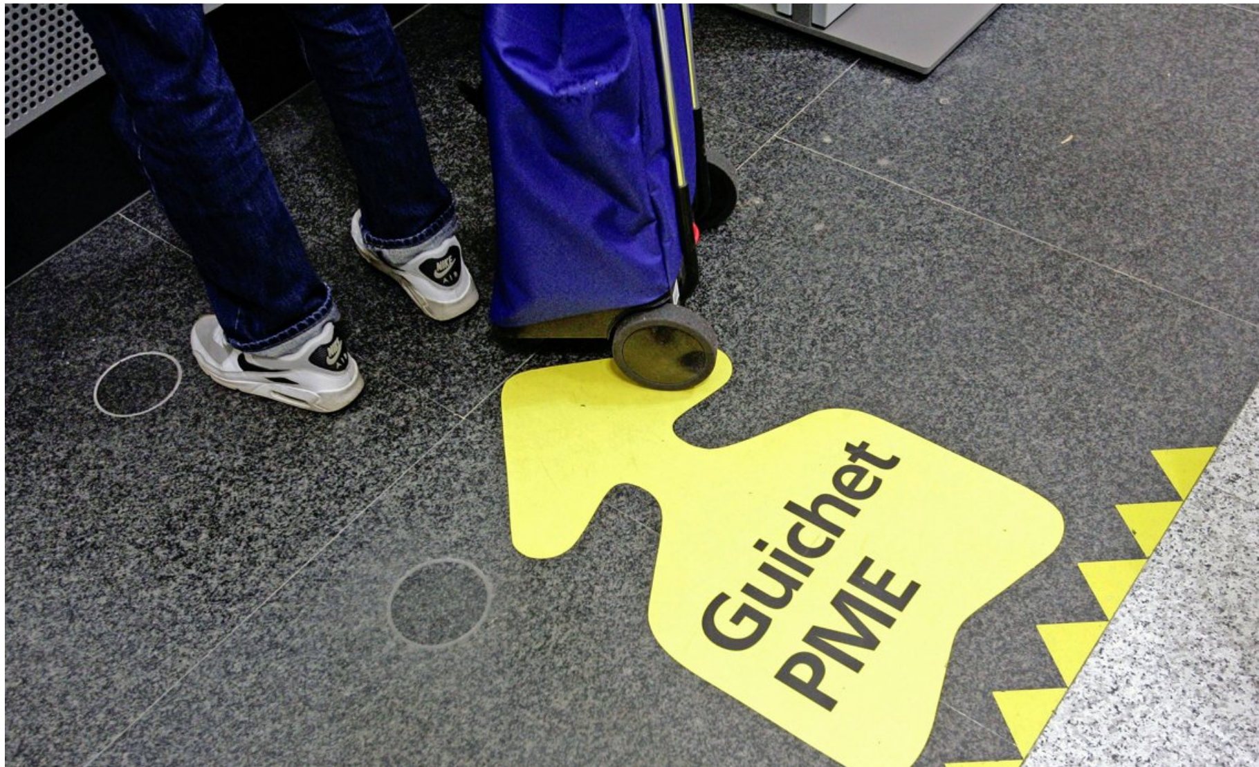
La plus importante part (77%) de l'aide aux PME genevoises concerne le cautionnement aux crédits bancaires ou de leasing. FLORIAN CELLA